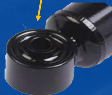
Buje de sujeción reforzado